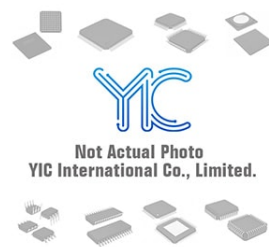
BSS63 E6327 NXP NXP SOT23