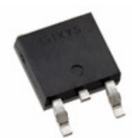
IXFY30N25X3 IXYS Corporation MOSFET N-CH 250V 30A TO252AA