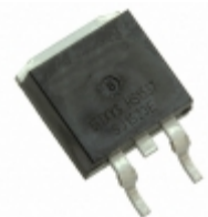
IXFY4N85X IXYS MOSFET N-CH 850V 3.5A TO252-3