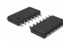
BU7464SF-E2 Rohm Semiconductor IC OPAMP GROUND SENSE 14SOIC