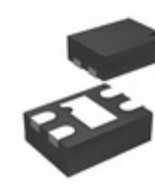
MIC5337-2.8YMT-TR Microchip Technology IC REG LDO 2.8V 0.3A 4TMLF