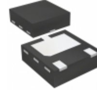
BC55-16PA,115 Nexperia USA Inc. TRANSISTOR NPN 60V 1A SOT1061