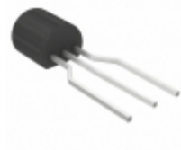
BC549TFR Fairchild/ON Semiconductor TRANS NPN 30V 0.1A TO-92