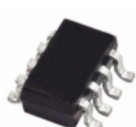
ADG3243BRJ-REEL7 Analog Devices Inc. IC SW BUS CTRL 2.5/3.3V SOT23-8