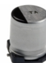
EEV-TA1V470P Panasonic Electronic Components CAP ALUM 47UF 20% 35V SMD