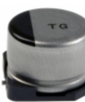
EEV-TG1A101P Panasonic Electronic Components CAP ALUM 100UF 20% 10V SMD