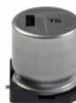
EEV-TG1A102Q Panasonic Electronic Components CAP ALUM 1000UF 20% 10V SMD