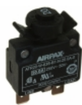
ATR20-W-63S-B1-N-20.0A-0 Sensata Technologies/Airpax CIR BRKR THRM 20A 250VAC 50VDC