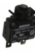
ATR20-W-63S-B1-N-12.0A-0 Sensata Technologies/Airpax CIR BRKR THRM 12A 250VAC 50VDC