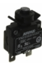
ATR20-W-63S-B1-N-5.0A-0 Sensata Technologies/Airpax CIR BRKR THRM 5A 250VAC 50VDC