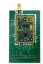
ATR2406-DEV-BOARD2 Microchip Technology BOARD DEV FOR ATR2406/ATMEGA88