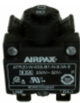
ATR20-W-63S-B1-N-8.0A-0 Sensata Technologies/Airpax CIR BRKR THRM 8A 250VAC 50VDC