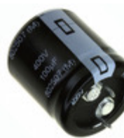
EET-HC2E681BF Panasonic Electronic Components CAP ALUM 680UF 20% 250V SNAP