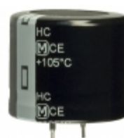
EET-HC2E561DA Panasonic Electronic Components CAP ALUM 560UF 20% 250V SNAP