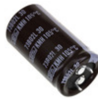
EKMH350VSN472MQ25T United Chemi-Con CAP ALUM 4700UF 20% 35V SNAP