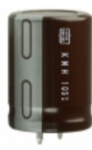
EKMH350VSN562MQ30T United Chemi-Con CAP ALUM 5600UF 20% 35V SNAP