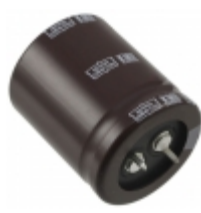
EKMH350VSN682MP40T United Chemi-Con CAP ALUM 6800UF 20% 35V SNAP