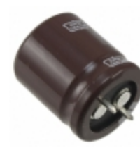
EKMH350VSN472MQ25S United Chemi-Con CAP ALUM 4700UF 20% 35V SNAP