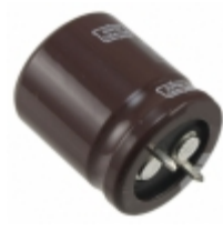
EKMH350VSN562AR25T United Chemi-Con CAP ALUM 5600UF 35V SNAP