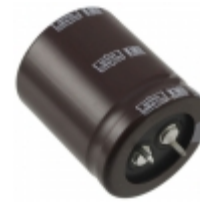
EKMH350VSN682MP40T United Chemi-Con CAP ALUM 6800UF 20% 35V SNAP