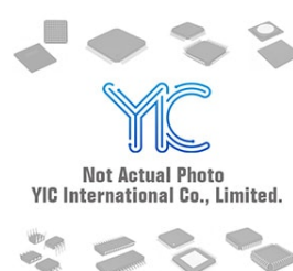
MIC39150-2.5WU TR MICREL MIC39150-2.5WU TR MICREL