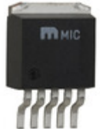
MIC39151-1.65BU TR Microchip Technology IC REG LDO 1.65V 1.5A TO263-5