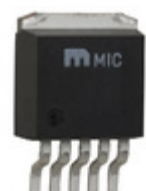
MIC39151-1.65WU-TR Microchip Technology IC REG LDO 1.65V 1.5A TO263-5