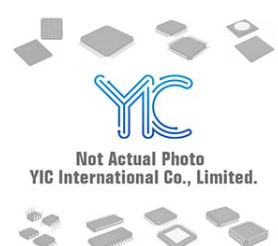
MIC39150-2.5WU TR MICREL MICREL TO-263