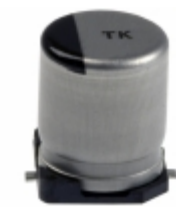
EEE-TK1A331UP Panasonic Electronic Components CAP ALUM 330UF 20% 10V SMD