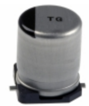
EEE-TG2A470Q Panasonic Electronic Components CAP ALUM 47UF 20% 100V SMD