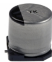
EEE-TK1A471UP Panasonic Electronic Components CAP ALUM 470UF 20% 10V SMD