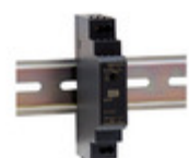
HDR-15-12 MEAN WELL AC/DC CONVERTER 12V 15W