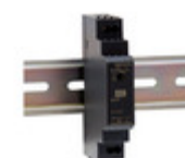
HDR-15-48 MEAN WELL AC/DC CONVERTER 48V 15W