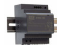
HDR-100-48N MEAN WELL AC/DC CONVERTER 48V 101W