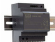
HDR-100-24N MEAN WELL AC/DC CONVERTER 24V 101W