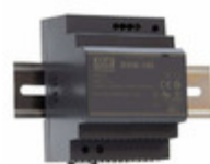
HDR-100-24 MEAN WELL AC/DC CONVERTER 24V 92W