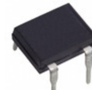
DF10M Diodes Incorporated RECT BRIDGE GPP 1000V 1A DF- M