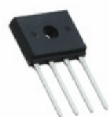
UR8KB100 C2G TSC (Taiwan Semiconductor) BRIDGE RECT 1PHASE 1KV 8A D3K