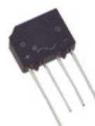
KBP08M-M4/51 Electro-Films (EFI) / Vishay RECT BRIDGE 1.5A 800V KBPM