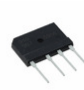
GBJ2506TB Sensitron Semiconductor / SMC Diode Solutions BRIDGE RECT 1PHASE 600V 25A GBJ