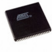
ATF1508AS-15JI84 Microchip Technology IC CPLD 128MC 15NS 84PLCC