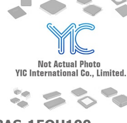
ATF1508AS-15QU100 ATMEL ATMEL QFP