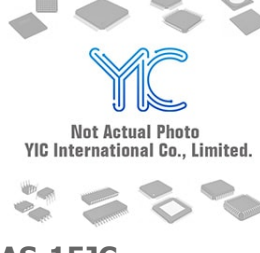
ATF1508AS-15JC ATMEL ATMEL PLCC84