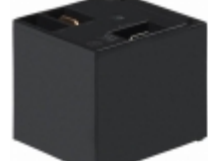
JTN1S-TMP-F-DC9V Panasonic Electric Works RELAY GEN PURPOSE SPDT 20A 9V