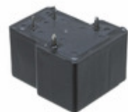
JTN1S-TMP-F-DC6V Panasonic Electric Works RELAY GEN PURPOSE SPDT 20A 6V