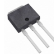
2SC4134T-E ON Semiconductor TRANS NPN 100V 1A TP