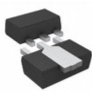
2SC4132T100P Rohm Semiconductor TRANS NPN 120V 2A SOT89