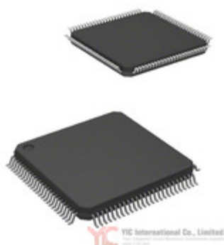
Image may be representation. See specs for product details.