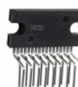
TDA8944J/N1,112 NXP USA Inc. IC AMP AUDIO PWR 7W STER 17SIL