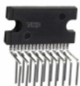
TDA8944AJ/N2,112 NXP USA Inc. IC AMP AUDIO PWR 7W STER 17SIL