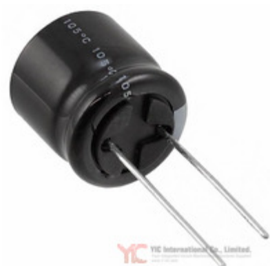
Image may be representation. See specs for product details.