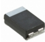
CWR29HB226KBFZ AVX Corporation CAP TANT 22UF 10% 15V 2214