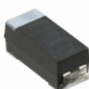
CWR29HB476JCGZ AVX Corporation CAP TANT 47UF 5% 15V 2711