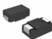
CWR29HB105KCAC AVX Corporation CAP TANT 1.0UF 10% 15V 1005