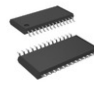
AT97SC3204-X1A190 Microchip Technology IC CRYPTO TPM LPC 28TSSOP