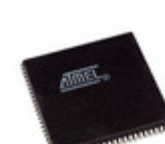
ATF1508ASL-20JC84 Microchip Technology IC CPLD 128MC 20NS 84PLCC