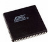
ATF1508ASL-25JI84 Microchip Technology IC CPLD 128MC 25NS 84PLCC