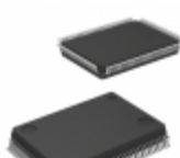
ATF1508ASL-20QC100 Microchip Technology IC CPLD 128MC 20NS 100QFP