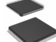
ATF1508ASL-25AU100 Microchip Technology IC CPLD 128MC 25NS 100TQFP