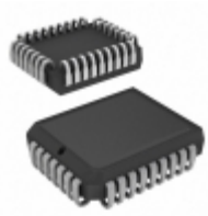
AT28C17E-20JI Microchip Technology IC EEPROM 16KBIT 200NS 32PLCC