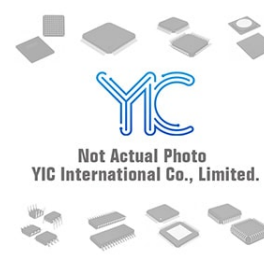
AT28C17-25SI AT AT SOP