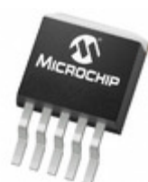
MCP1825-0802E/ET Microchip Technology IC REG LDO 0.8V 0.5A DDDPAK