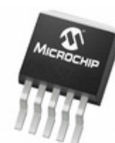
MCP1825-2502E/ET Microchip Technology IC REG LDO 2.5V 0.5A DDDPAK