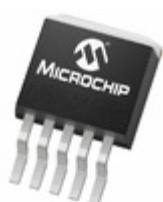
MCP1825-1202E/ET Microchip Technology IC REG LDO 1.2V 0.5A DDDPAK