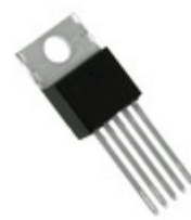
MCP1825-2502E/AT Microchip Technology IC REG LDO 2.5V 0.5A TO220-5