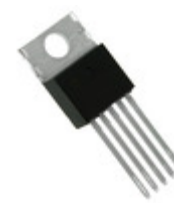
MCP1825-0802E/AT Microchip Technology IC REG LDO 0.8V 0.5A TO220-5