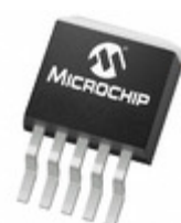
MCP1825-1802E/ET Microchip Technology IC REG LDO 1.8V 0.5A DDDPAK