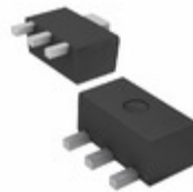
AP7365-25YRG-13 Diodes Incorporated IC REG LDO 2.5V 0.6A SOT-893L