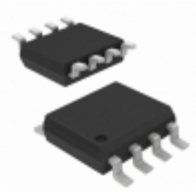
AT24C512C-SHM-T Micrel / Microchip Technology IC EEPROM 512K I2C 400KHZ 8SOIC