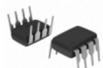
ALD1704PAL Advanced Linear Devices Inc. IC OPAMP GP 2.1MHZ RRO 8DIP