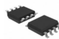
ALD1704BSAL Advanced Linear Devices Inc. IC OPAMP GP 2.1MHZ RRO 8SOIC