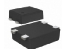
S-1000C38-I4T1U SII Semiconductor Corporation IC VOLT DETECTOR 38V SNT-4A