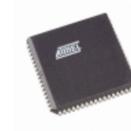
TS87C51RD2-MIL Microchip Technology IC MCU 8BIT 64KB OTP 68PLCC