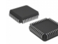
TS87C51RD2-MIB Microchip Technology IC MCU 8BIT 64KB OTP 44PLCC