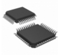
TS87C51RD2-MIE Microchip Technology IC MCU 8BIT 64KB OTP 44VQFP