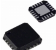
ADG904SCPZ-EP Analog Devices Inc. 1GHZ SPST SW (50 OHM TERMINATIO