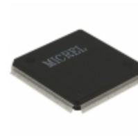
KSZ8999 Microchip Technology IC SWITCH 10/100 9PORT 208QFP