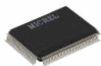
KSZ8995XA Microchip Technology IC SWITCH 10/100 5PORT 128QFP