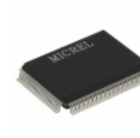
KSZ8997 Microchip Technology IC SWITCH 10/100 8PORT 128QFP