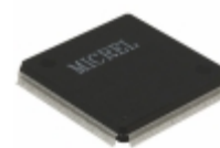
KSZ8999I Microchip Technology IC SWITCH 9-PORT 10/100 208QFP