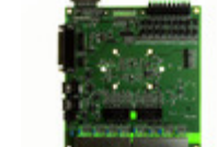
KSZ8999-EVAL Micrel / Microchip Technology BOARD EVALUATION FOR KSZ8999