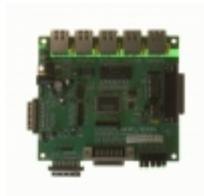
KSZ8995XA-EVAL Micrel / Microchip Technology BOARD EVALUATION FOR KSZ8995XA