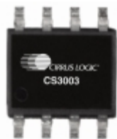
CS3003-INZ Cirrus Logic Inc. IC OPAMP INSTR RRO 8QFN