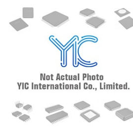
BD377 HGF BD377 HGF