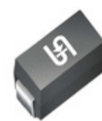
SMAJ75A M2G TSC (Taiwan Semiconductor) TVS DIODE 75V 121V DO214AC