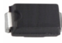
SMAJ75A-13 Diodes Incorporated TVS DIODE 75VWM 121VC SMA