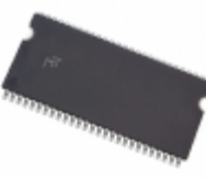
MT48LC32M4A2P-7E:G TR Micron Technology Inc. IC SDRAM 128MBIT 143MHZ 54TSOP