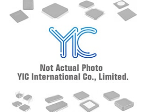
MT48LC32M16A2TG-75IT MT MT TSOP56