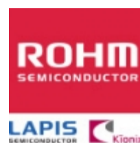
BR25L160F-W ROHM BR25L160F-W ROHM