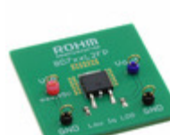
BD733L2FP-EVK-301 LAPIS Semiconductor LDO_EVK_BD7XXL2X BD733L2FP-C