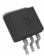
BD733L2FP2-CE2 LAPIS Semiconductor IC REG LDO 3.3V 0.2A TO263-3