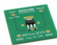
BD733L2FP3-EVK-301 LAPIS Semiconductor LDO_EVK_BD7XXL2X BD733L2FP3-C