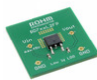
BD750L2FP-EVK-301 LAPIS Semiconductor LDO_EVK_BD7XXL2X BD750L2FP-C