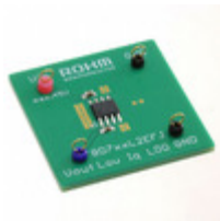
BD750L2EFJ-EVK-301 LAPIS Semiconductor LDO_EVK_BD7XXL2X BD750L2EFJ-C