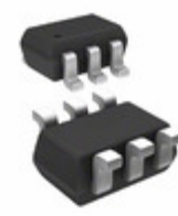
CMKT3920 TR Central Semiconductor Corp TRANS 2NPN 60V 0.2A SOT363