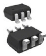
CMKT3920 TR Central Semiconductor Corp TRANS 2NPN 60V 0.2A SOT363