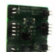
ADP1707-3.3-EVALZ ADI (Analog Devices, Inc.) BOARD EVAL FOR ADP1707-3.3