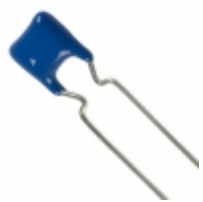
B37984M5474K000 EPCOS (TDK) CAP CER 0.47UF 50V X7R RADIAL