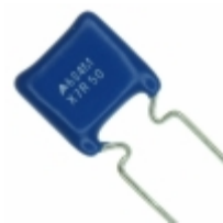
B37984M5684M051 EPCOS (TDK) CAP CER 0.68UF 50V X7R RADIAL