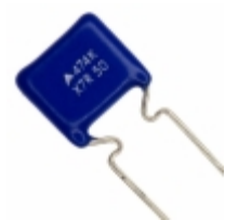
B37984M5474K051 EPCOS (TDK) CAP CER 0.47UF 50V X7R RADIAL