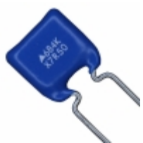
B37984M5684K051 EPCOS (TDK) CAP CER 0.68UF 50V X7R RADIAL