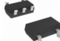
S-80839CNMC-B8YT2G SII Semiconductor Corporation IC VOLT DETECTOR 3.9V SOT23-5