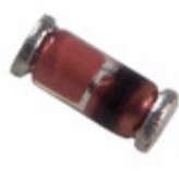
BA604-GS18 Vishay Semiconductor Diodes Division DIODE GP 50V 200MA SOD80