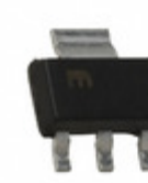
MIC2920A-5.0BS TR Microchip Technology IC REG LDO 5V 0.4A SOT223