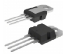
MIC2920A-4.8BT Microchip Technology IC REG LDO 4.85V 0.4A TO220-3