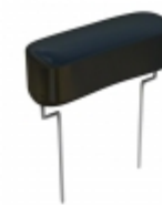
DPFF12D27J-F Cornell Dubilier Electronics (CDE) CAP FILM 2700PF 5% 1.2KVDC RAD