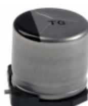
EEV-TG1E331UP Panasonic Electronic Components CAP ALUM 330UF 20% 25V SMD