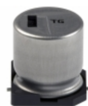
EEV-TG1E331Q Panasonic Electronic Components CAP ALUM 330UF 20% 25V SMD