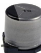
EEV-TG1E221P Panasonic Electronic Components CAP ALUM 220UF 20% 25V SMD