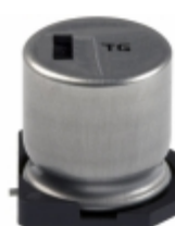
EEV-TG1E471Q Panasonic Electronic Components CAP ALUM 470UF 20% 25V SMD