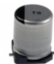
EEV-TG1E221UP Panasonic Electronic Components CAP ALUM 220UF 20% 25V SMD