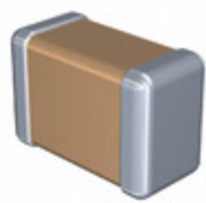
C1206C131G3HACAUTO KEMET CAP CER 1206 130PF 25V ULTRA STA