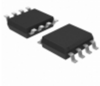
MIC5239-3.15BM-TR Microchip Technology IC REG LDO 3.15V 0.5A 8SOIC