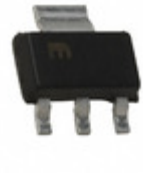
MIC5239-3.15BS Microchip Technology IC REG LDO 3.15V 0.5A SOT223