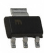
MIC5239-3.15BS TR Microchip Technology IC REG LDO 3.15V 0.5A SOT223