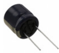
EEU-FC1J271B Panasonic Electronic Components CAP ALUM 270UF 20% 63V RADIAL