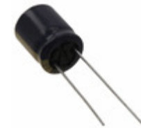
EEU-FC1J221XB Panasonic Electronic Components CAP ALUM 220UF 20% 63V RADIAL