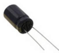
EEU-FC1J221SB Panasonic Electronic Components CAP ALUM 220UF 20% 63V RADIAL